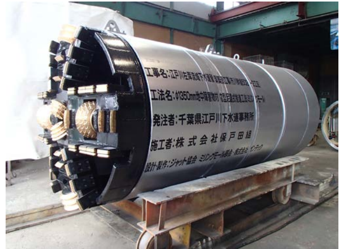
φ1350mm ミリングモール掘進機

下段の工事の際に(φ1350mm 泥水工法, 他社施工)固いソイル状の障害物がありビットが破損した経緯がある為、設計変更となった現場である。発進及び到達を安全に施工する為に、圧入ケーソン壁を(無筋の予定であったが実際は鉄筋が少々混入している)発進側でL=0.9m、到達側でL=0.3m切削した。