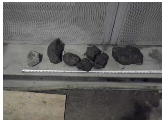
排出したコンクリ片。