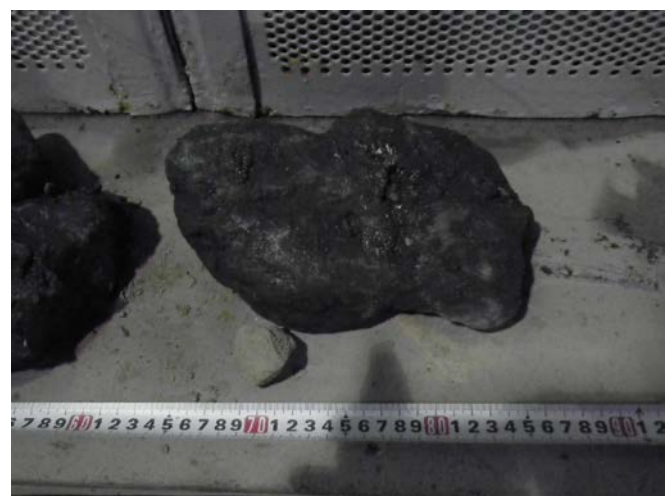
排出したコンクリ片。