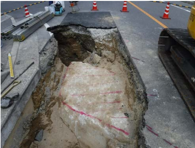
2か所目 無筋コンクリート