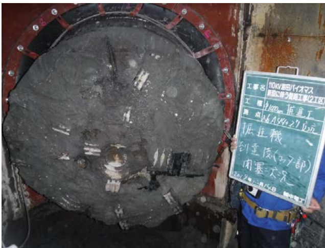
No.1 中間立坑 到達状況