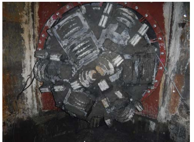
No.2 中間立坑 到達状況