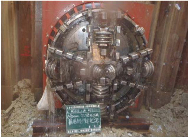
下段推進到達状況