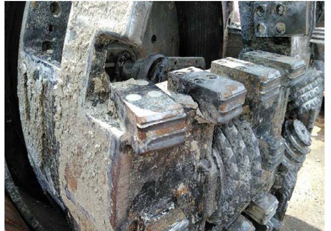
推進完了後カッタービット