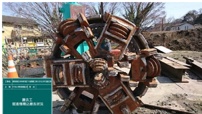
掘進機7分割回収(カッター部)