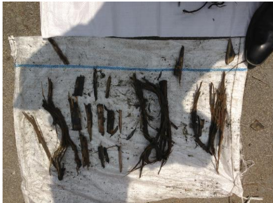
切削し排出された木片

この現場は障害物が松杭であることから電磁波による前方探査とデータロガーによる掘削管理を行いました。