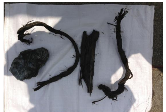
排出されたワイヤー片 ( \phi 16) と礫

木杭であることから掘削トルクの上昇や推進力の上昇は見られず、木片の排出によって障害物切削の有無を確認しました。