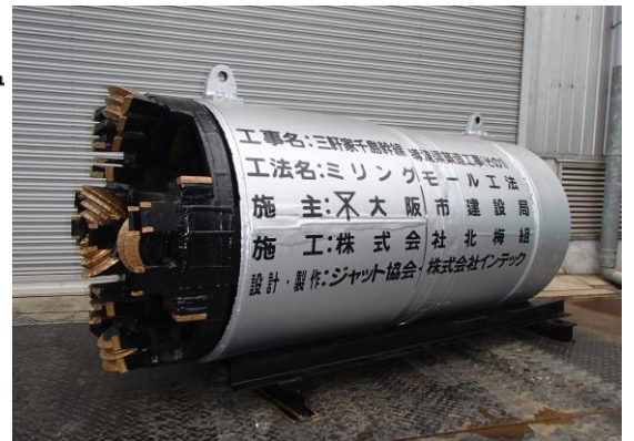
\phi 800mm ミリングモール掘進機