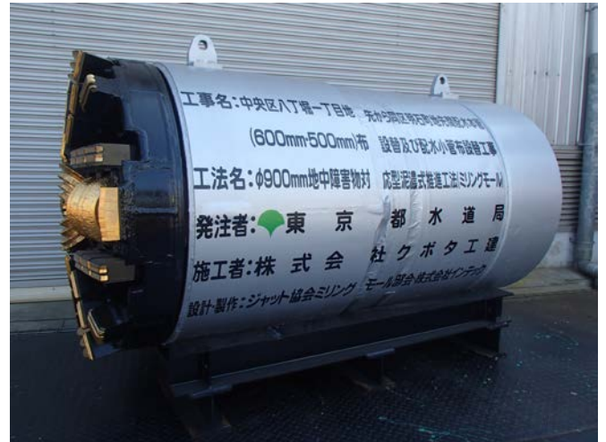
φ 900mm ミリングモール掘進機