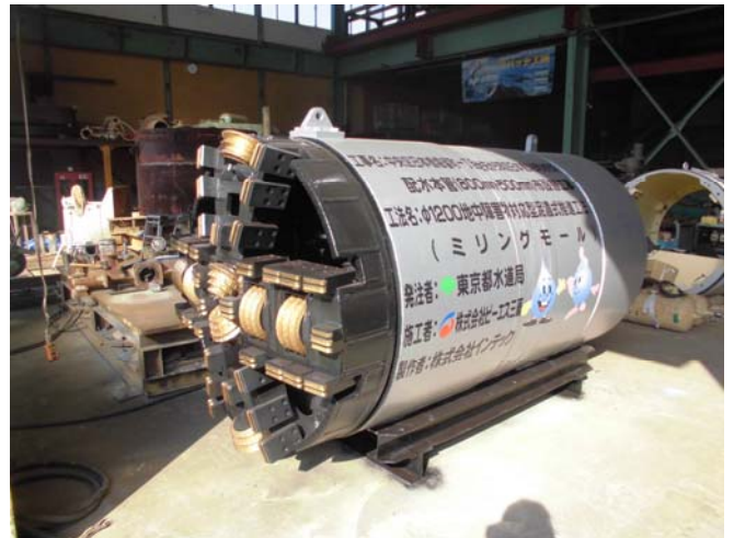
φ 1200mm ミリングモールド掘進機