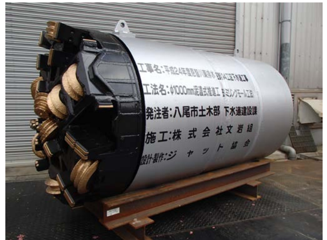
φ1000mm ミリングモール掘進機

当現場は、推進管路部に発進直後 5.5m 付近で H 鋼(H-300)が存在すると考えられる。障害物である H 鋼を斜めに切削していきましたが、通過後 4m 付近で二か所目の H 鋼を同じく斜めに切削し、その後は通常掘進を行いました。結果として H 鋼(H-300) 2箇所を切削した。また金属片の排出を確認しました。