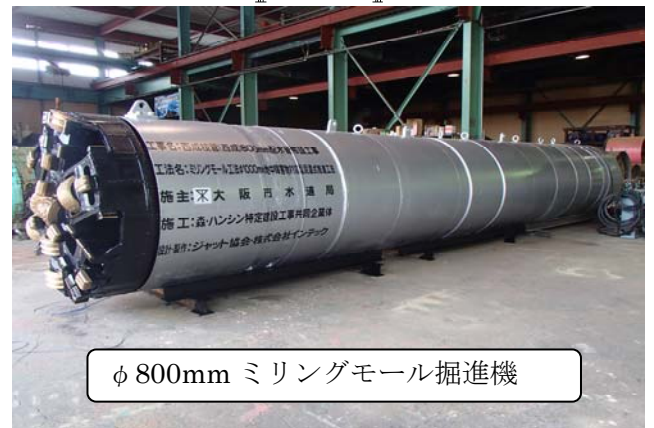
φ800mm ミリングモールド掘進機

施工結果、1箇所目の障害物(鋼矢板Ⅲ型)の金属反応はなく、実際に金属片の排出もありませんでした。機内薬液注入を施工し、推進を進め2箇所目の障害物(鋼矢板Ⅲ型)の金属反応を確認し、機内薬液注入を施した後、障害物の切削を開始、金属片の排出を確認しました。