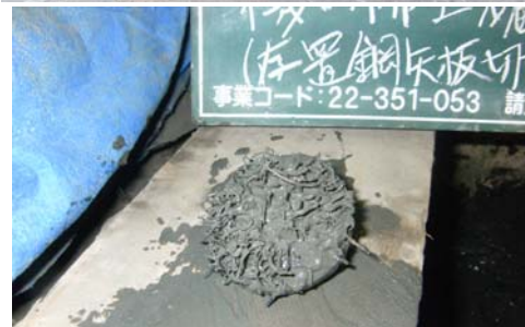
切削粉(鉄片)磁石に付着確認