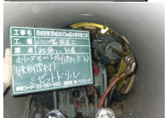
機内薬液注入状況