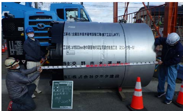
φ mmリングモールド掘進機