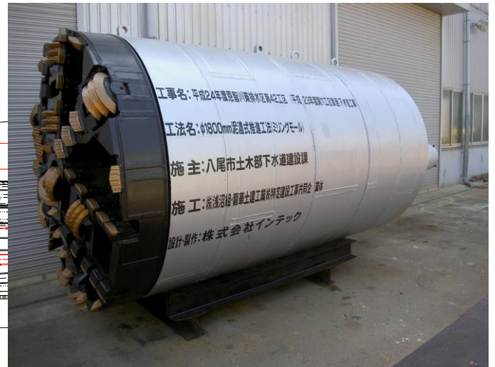
φ 1800mm ミリングモール掘進機