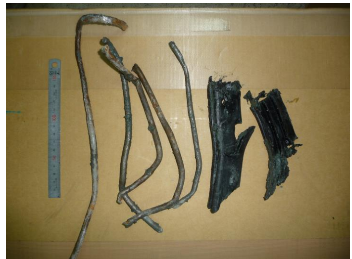
排出した金属片。推進管のカラー及び鉄筋

発進直後から 8. 21m の区間において障害物である既設推進用ヒューム管 φ 1800mm を斜めに切削していき、その後通常の掘進を行い既設の特殊人孔に到達する工事である。既設人孔ではヘッドは全損でそれ以外は分解して回収する計画である。