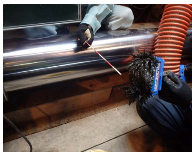
障害物切削 モニタリング状況