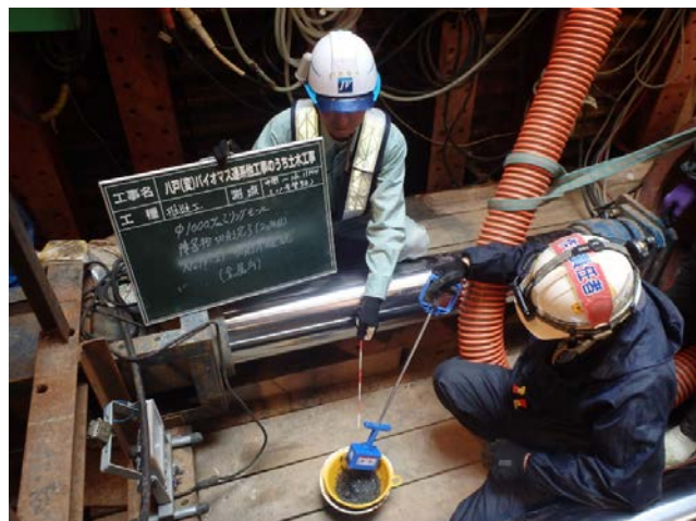
障害物切削 切削片確認(金属片)