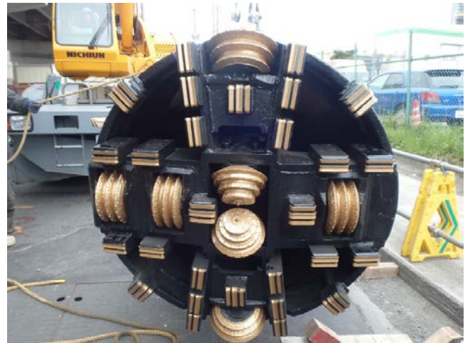
φ 1000mmミリングモール掘進機検尺