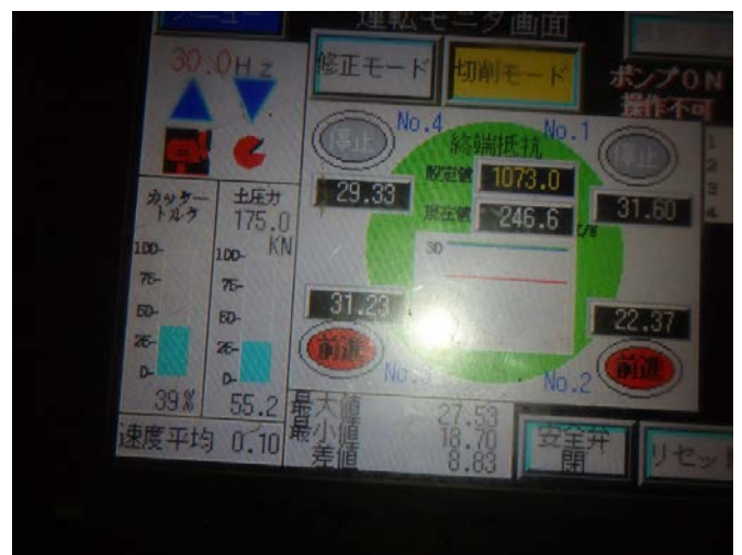
掘進機内(伸縮管)切削状況

基線上に昔の用水路が有り駐車場に乗り入れの為の橋がありました。その基礎杭として鋼管杭(φ 600mm)が4本あり、高架下の交差点で入口が駐車場の為、開削が出来ないのでリングモール工法で切削する事になりました。