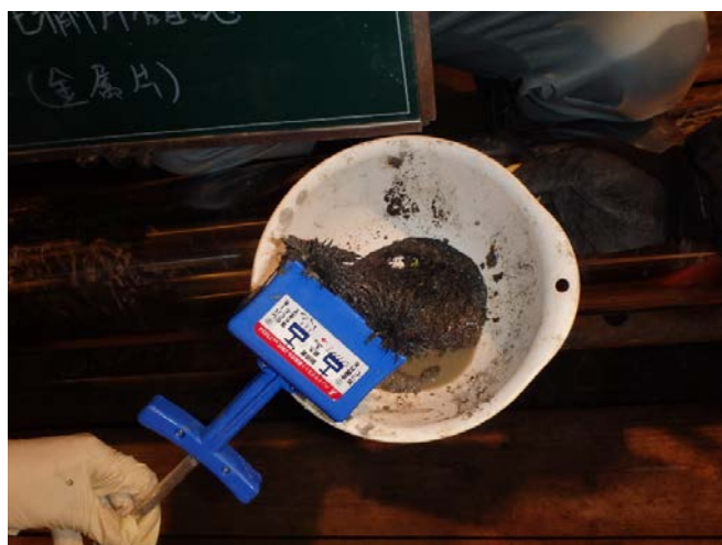
障害物切削 切削片確認(金属片)