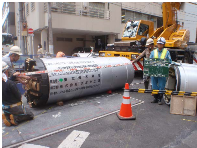
φ 900mm ミリングモール掘進機