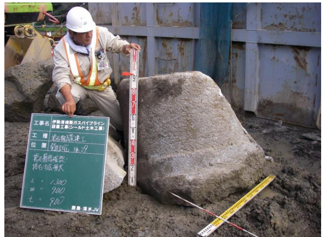
発進立坑掘削時に出土した旧護岸石積(巨礫) 巨礫径(1300mm×900mm×900mm)