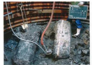
Con支障物状況(15リング目)