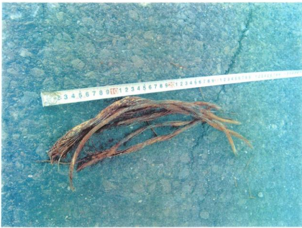
推進中に排出したワイヤー片

この現場は、旧護岸石積(巨礫)の出土にくわえ事前の磁気探査の結果、何らかの金属反応があるため、ミリングモール工法の採用となりました。発進立坑掘削時の石積群やテトラポット等の出土はφ1000mmの呼び径に対し、非常に大きく切削困難なものでした。推進管もミリング専用のローリング防止機能付き合成鋼管を使用しました。施工中には巨礫の破砕片とワイヤーが出土し、金属反応はこのワイヤーであり、ワイヤーカゴに入った巨礫であったのではと思われた。