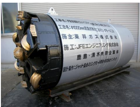
φ1000mm ミリングモール掘進機