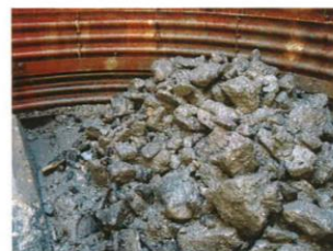
捨石状況(15リング目)