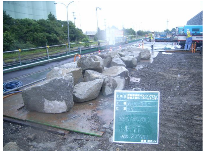
発進立坑掘削時に出土した旧護岸石積(巨礫)