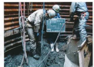
コンクリート取壊(15リング目)