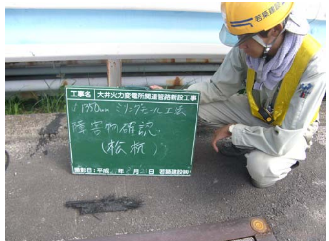
排出された木片(松杭)