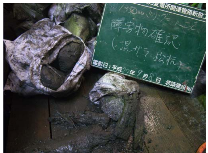
排出されたコンクリートガラと木片(松杭)

本工事は、大井火力内の管路新設工事で、敷地全般が埋め立ての為、確実にシートパイルやH鋼等が出るということではなく、コンクリートガラや金属片など、何が出てもおかしくないという状態でした。実際は、松杭や、何かのベースと思われるコンクリートガラのみで、伸縮ジャッキの使用には至りませんでした。