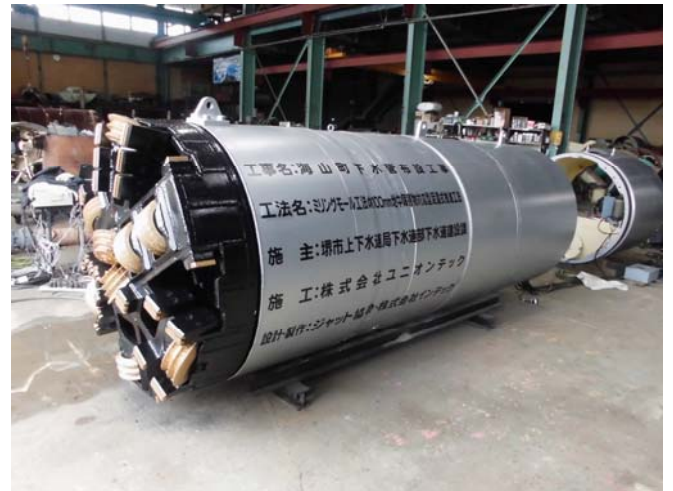
φ1100mm ミリングモール掘進機