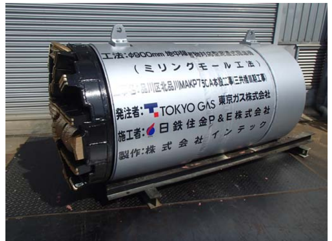
φ900mm ミリングモール掘進機

障害物を地上から撤去することが困難であり、超軟弱土の施工であったため、入念な検討を必要としました。推進管は全て緊結可能な合成管を使用し、掘進機には2箇所の蛇行修正装置を備え施工を行いました。施工結果、鋼矢板Ⅲ型及びH-400は無く、木杭250mm程度を2箇所切削しました。