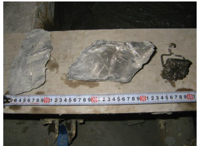
排出したコンクリート片、金属片。

この工事をするに当たり、推進管路部に地下連絡通路及び東京メトロ丸の内線の基礎杭が存置されている可能性がある。基礎杭の存置する箇所が道路交通の多い都心部であり、かつ推進管路の埋設深が非常に深い為、発進及び到達を安全に施工する必要がある。実際の施工では杭は無く、到達立坑のライナー6段、H-150mm 5本、人孔の鉄筋コンクリート壁1mを切削した。