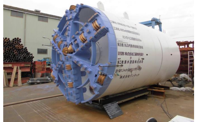
φ2600mm ミリングモール掘進機