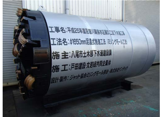
φ1650mm ミリングモール掘進機

呼び径：φ1650mm 推進延長：325.470m (200R 1カーブ) 土質：(砂質土及び粘性土) N値：50 礫率：0% 最大礫径：19mm 地下水位：GL-1.35m 土被り：10.58m