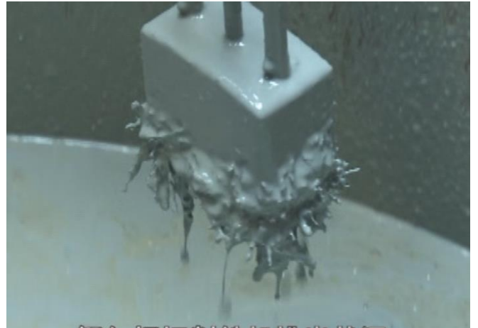
2012.02.03 真空排泥タンク内へ磁石を投入し引き上げた状態写真 排出された泥土内から切削した金属粉の付着を確認

通常推進すると言った工事内容です。地質は埋立地でもあり、砂礫、砂、粘性土の複層する地盤で、障害物である鋼矢板Ⅲ型は今回施工した管路上部に並走する汚水管の人孔施工時に残置されたもので、その 6 箇所全て掘削する全断面に障害となる高さで施工を行いました。