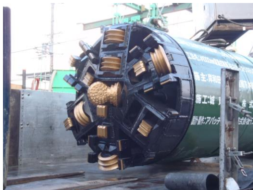
φ1000mm ミリングモール掘進機

工期: 昼夜間施工(16h)3ヶ月 (2011.12.20~2012.3.15)